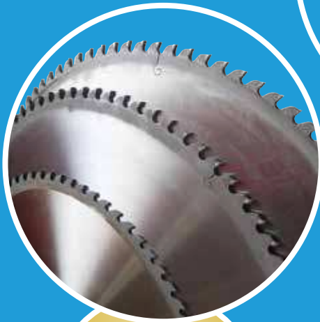
CARBURE (alu, plastique, PVC, bois...)